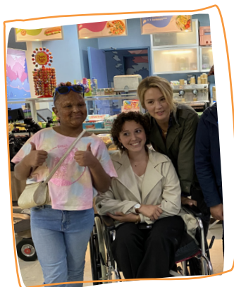
2022 2 e rêve Tournage d'une série