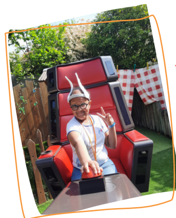
2023 3 e rêve Rencontre avec les Talents The Voice au Parc Astérix